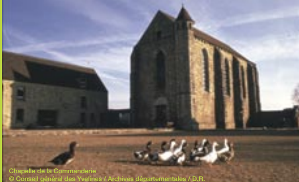
Chapelle de la Commanderie

Dimanche 17 septembre à 16h30, Élancourt