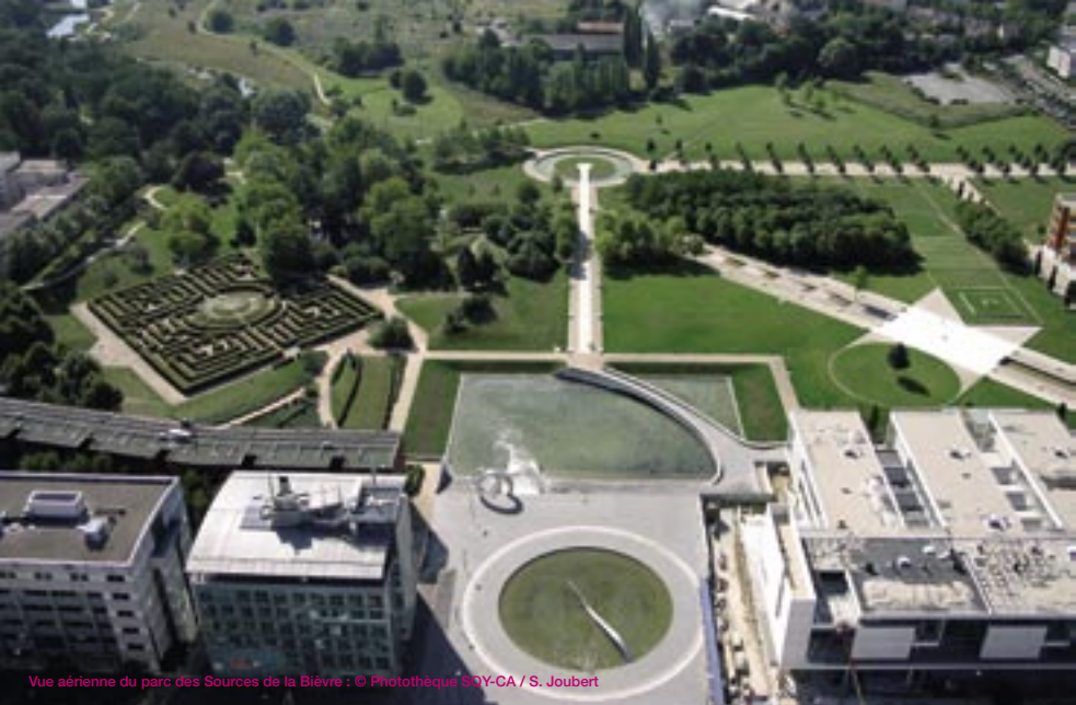
Vue aérienne du parc des Sources de la Bièvre