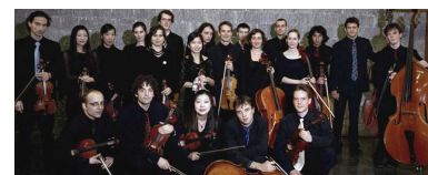
L'ensemble Les Cordes

L'ensemble « Les Cordes » cultive l'esprit de découverte. C'est un orchestre de 22 musiciens pensé comme un ensemble de musique de chambre. Avec passion, ses musiciens creusent le sillon de l'extrême exigence du travail des instruments à cordes. Par le choix de se produire sans chef, par l'engagement intense des vingt-deux musiciens, l'ensemble se nourrit de l'énergie de chacun, menée par le quintette des solistes.